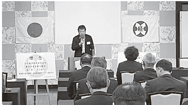
年度 次年度役員を囲む 次年度役員を囲む