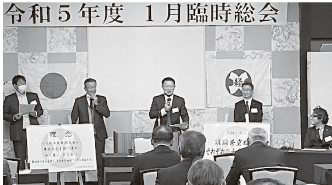
令和5年度 1月臨時総会