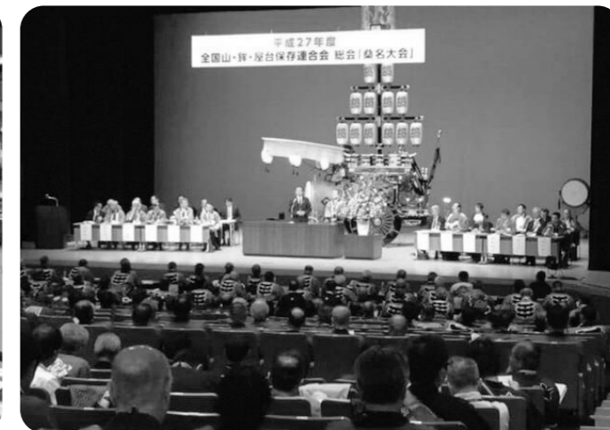
“ユネスコ支援応援隊” 事業スケジュール (2015.4～2016.3)